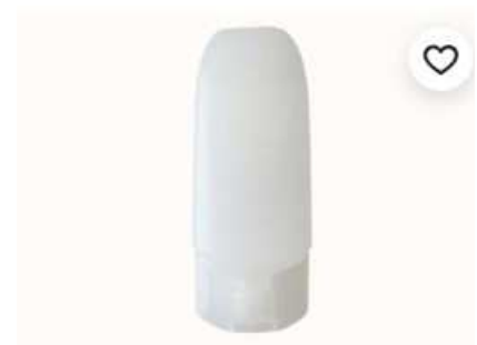
Tube en plastique Tottle 125 ml